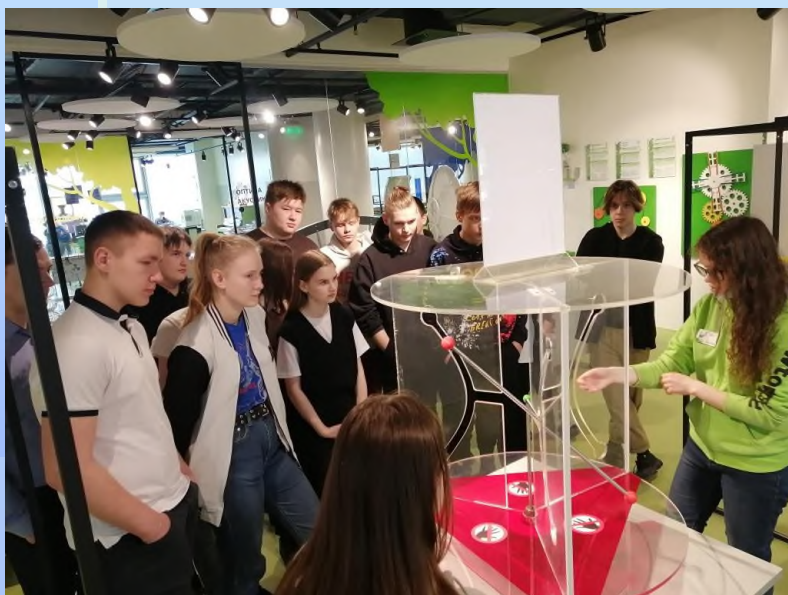
Интерактивный музей науки для взрослых и детей «Ньютон - Парк», г.Екатеринбург