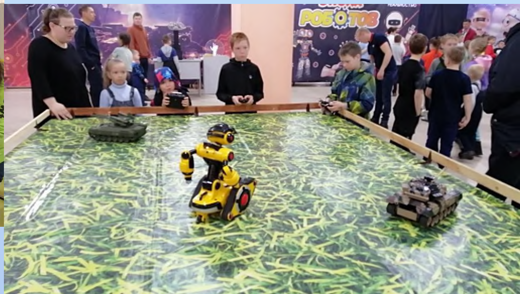
Интерактивная выставка «Эпоха роботов» с дополненной реальностью, г.Ирбит