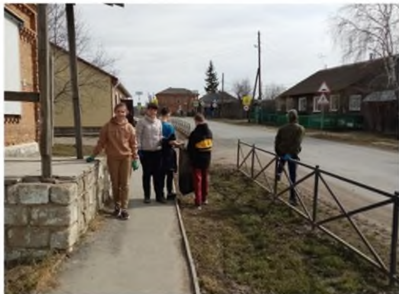
Акция «Чистая деревня»