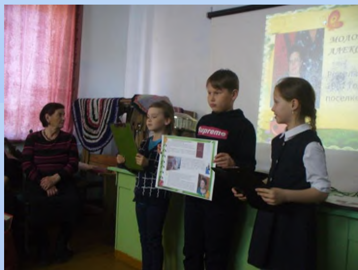
«Нам память нужно сохранить»