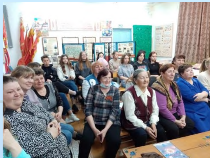
«Люди в белых халатах»