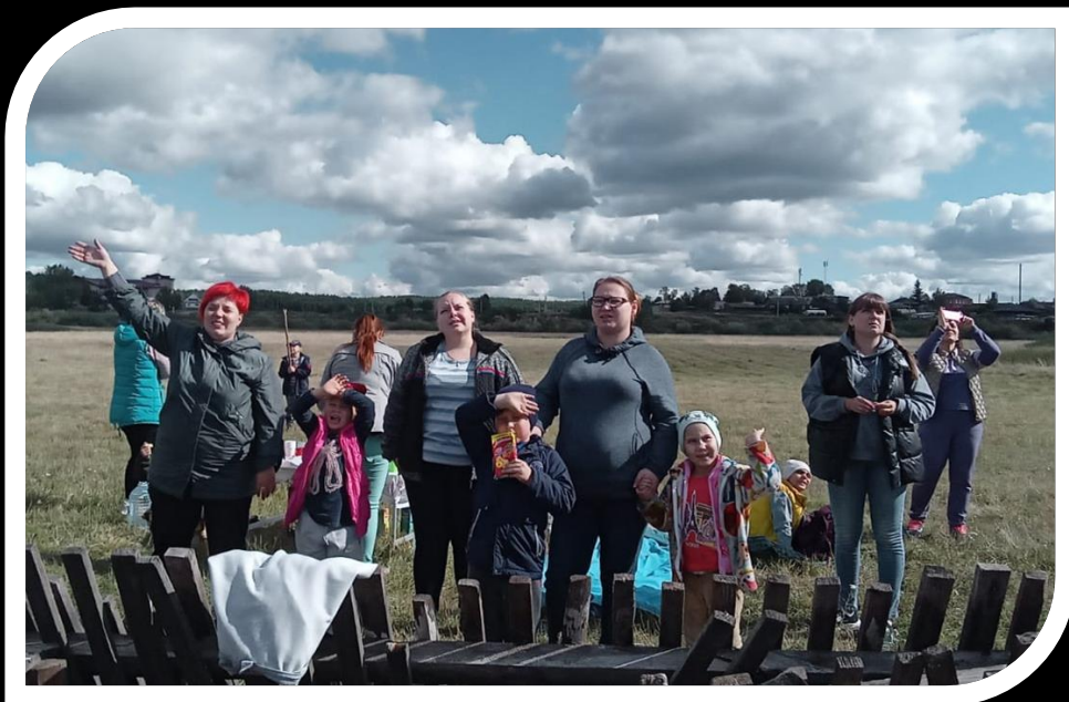
День выходного дня

Цель: осознание учащимися значимости семьи в жизни любого человека