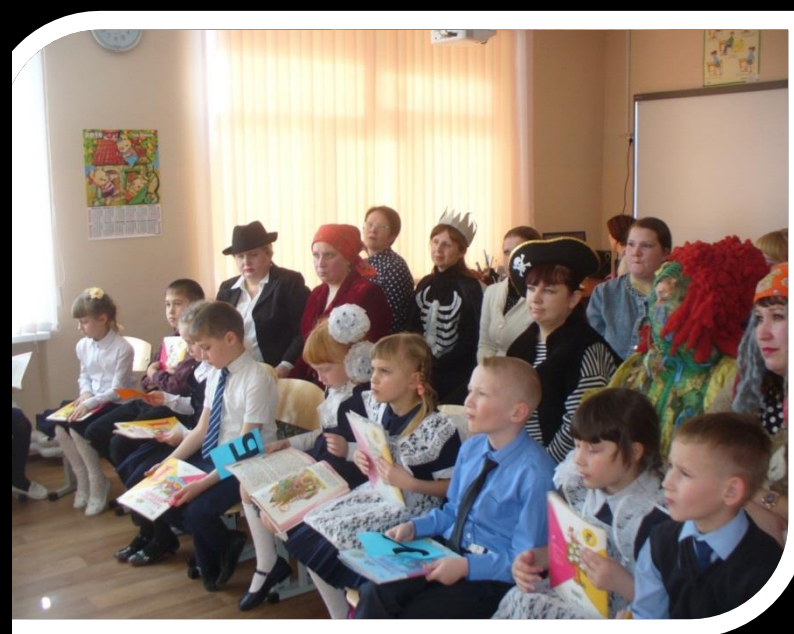
Праздник «Прощание с Азбукой»