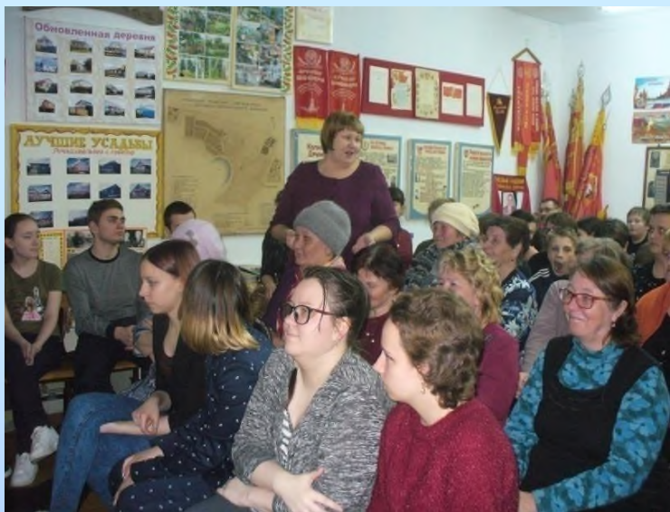
«Слава тебе, солдатская мать!»