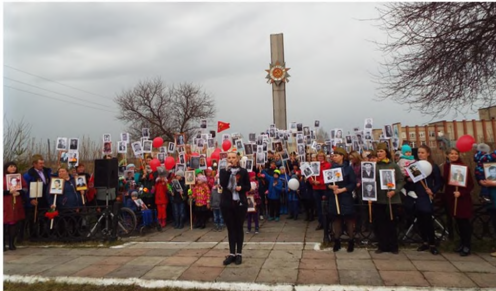
Митинг Памяти у обелиска