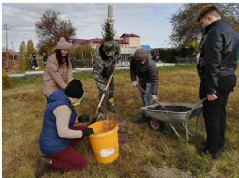
Акция «Сад Памяти»